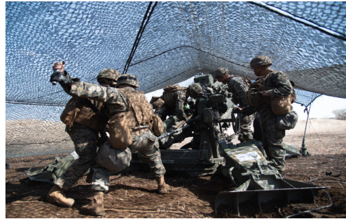
米海兵隊の実弾射撃訓練 北富士演習場、4月19日

陸上自衛隊北富士演習場（富士吉田市、山中湖村）で4月19日から在沖縄米海兵隊による155ミリリゅう弾砲の実弾射撃訓練が行われました。演習場の全面返還を求める「北富士共闘会議」が14日、甲府駅南口駅前広場で、約20人が参加して「県民の誇り富士山に砲撃を撃ち込むな」などと書かれたプラカードを掲げ抗議活動を行いました。